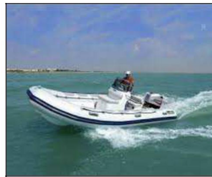
Embarque - Desembarque